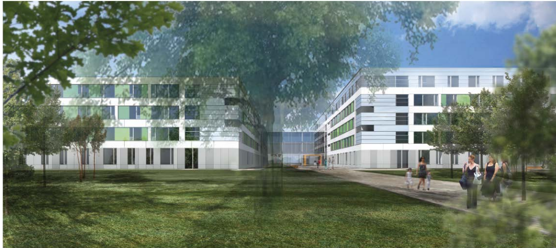
LVR-Klinikum Düsseldorf – Neubau DTFZ / Diagnostik-, Therapie- und Forschungszentrum – 1. Bauabschnitt